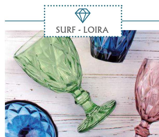
SURF - LOIRA